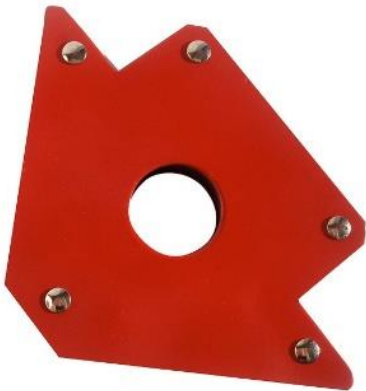
Imagen a modo ilustrativo:

Se deberán proveer CUATRO (4) escuadras imantadas de CINCO (5") pulgadas de CIENTO TREINTA Y CINCO por CIENTO TREINTA Y CINCO (135 mm x 135 mm) mm con hipotenusa de CIENTO CINCUENTA (150) mm para soldaduras en múltiples posiciones: 45°, 90° y 135°.