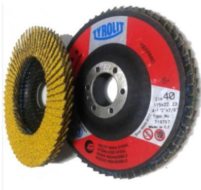
Imagen a modo ilustrativo:

Se deberá proveer UNA (1) caja de discos flap tipo línea expert tools marca Tyrolit o similar de calidad superior. El disco flap deberá ser convexo de fibra de vidrio para metales en general y de óxido de circonio de 4 ½" de medidas 115x22,2 con una granulometría de grano OCHENTA (80). Cada caja deberá incluir un total de DIEZ (10) discos.