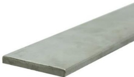
Imagen a modo ilustrativo:

Se deberá proveer la cantidad de 10 (DIEZ) planchuelas de acero de aristas redondeadas de MEDIA pulgada (1/2") de ancho por TRES DIECISEISAVOS de pulgada (3/16") de espesor. Cada planchuela será de SEIS (6) m de largo.