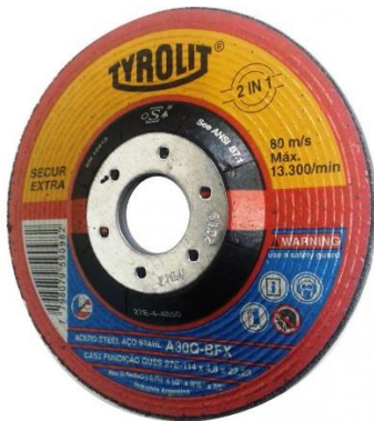
Imagen a modo ilustrativo: