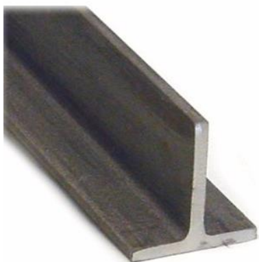
Imagen a modo ilustrativo:

Se deberá proveer la cantidad de 10 (DIEZ) planchuelas "T" de acero de aristas redondeadas y perfil laminado, de 1" x 1" y de 3/16" de espesor. Cada planchuela tendrá un largo de 6 m.